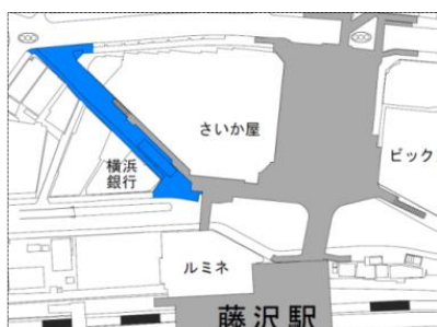
サンパレット位置図

新たな駅前のにぎわいづくりの一つとして、平成28年度に再整備を終えたサンパレット（さいか屋西側の歩道）を使用したさまざまなイベント等を実施しています。これにより今後の駅周辺も見据えたにぎわいや交流、憩いをつくるための仕組み等を検討していきます。