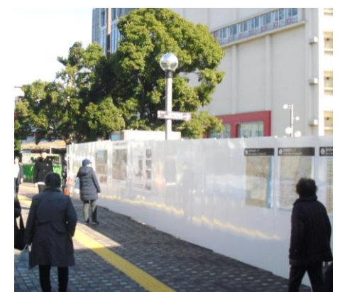
駅から北側方面へ