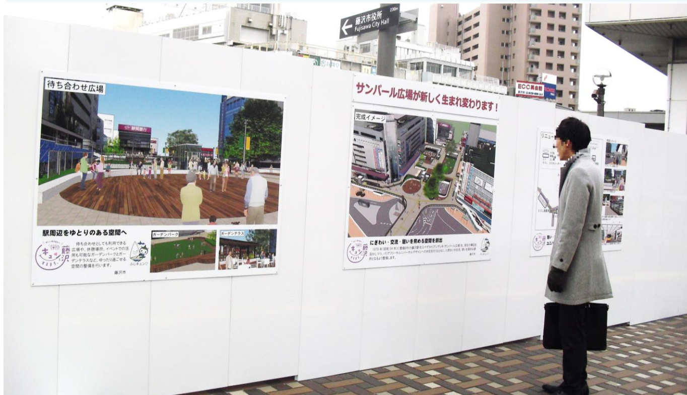
完成イメージの掲示