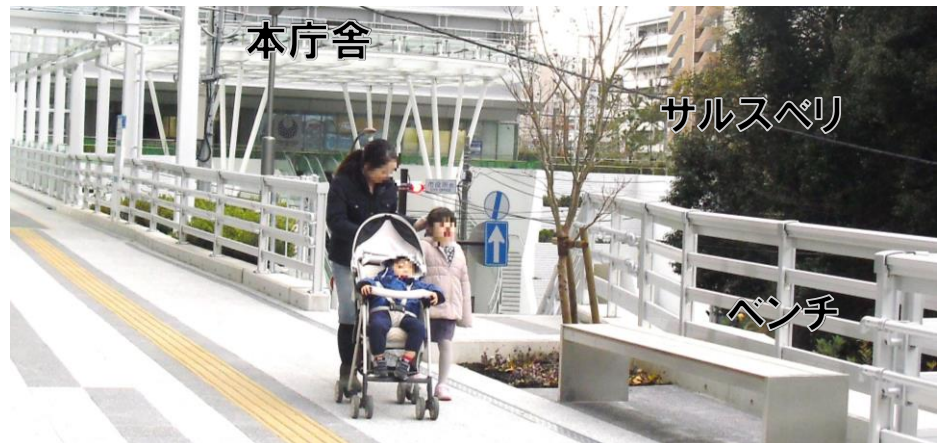
花咲く木陰のベンチ(2017年(平成29年)11月寄贈)