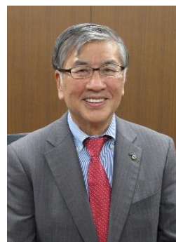
藤沢市長 鈴木恒夫