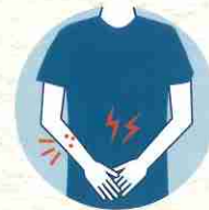
下痢、結膜炎、皮膚の発疹、手足の指の変色

イベントや打ち合わせ等において、2週間前より当日までに下記症状を自覚した方には参加を控えていただく。