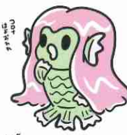
アマビエ(無料イラスト)