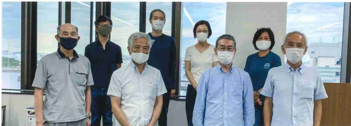
8月1日（土）波止場会館にて