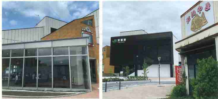
(上段) (下段2枚) 憩いの場となった旧駅舎、新駅舎と昔懐かしい鯛焼き屋さん

※「いわき・まごころ双葉会」はいわき市に避難されている双葉町民の自治会（118世帯）です。