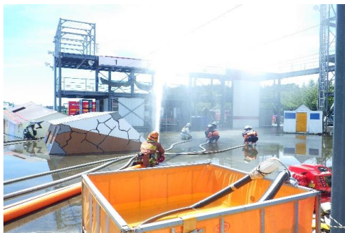
6-(20) 遠距離送・排水システム車を活用した 火災防ぎょ訓練