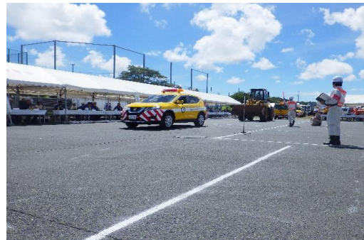
6-(13) 道路啓開・復旧訓練