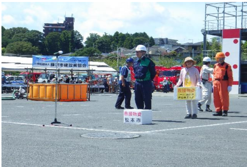
6-(17) 緊急物資搬送訓練