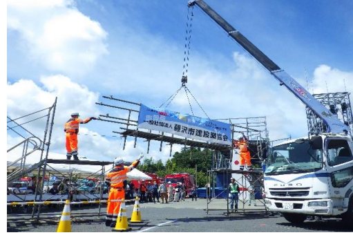
6-(13) 道路啓開・復旧訓練