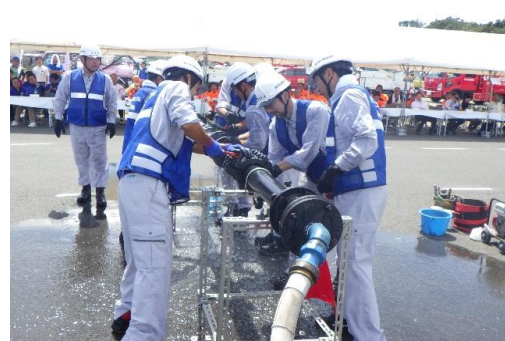
6-(22) ライフライン復旧訓練(水道管復旧)