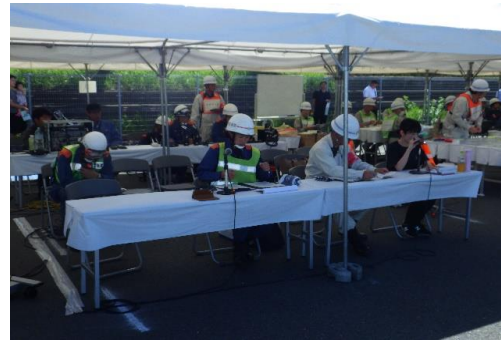
6-4) 情報収集伝達訓練(消防局)