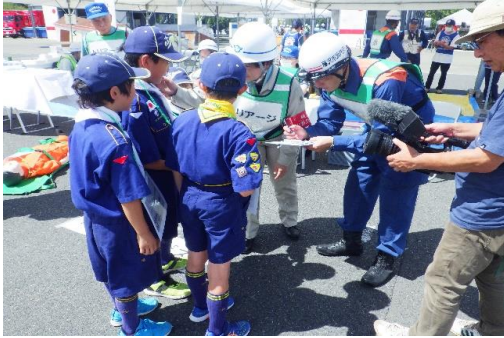
6-(9) 応急救護所開設・運営訓練