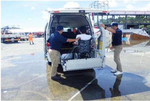
6-(14) 傷病者緊急搬送訓練