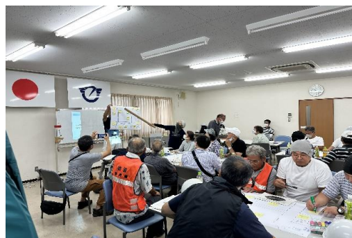
6-5) 避難所開設・運営訓練