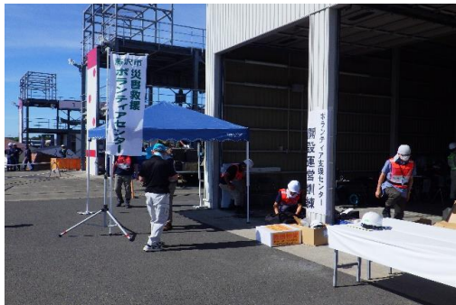
6-(10) ボランティアセンター開設・運営訓練