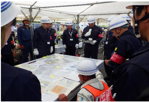
6-3) 災害対策本部設置訓練