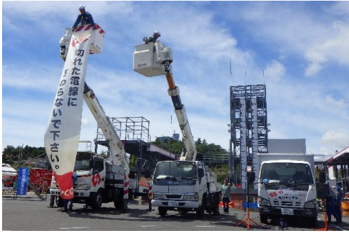
6-(22) ライフライン復旧訓練(電源復旧)