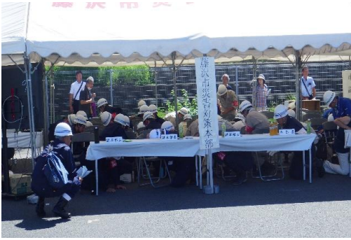
6-1) シェイクアウト訓練