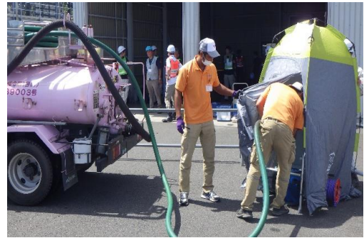
6-(23) 一般ごみ・し尿対応訓練