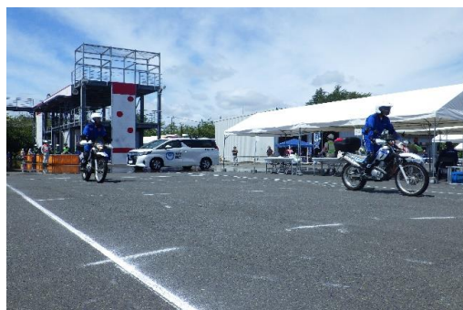
6-(21) ライフライン状況確認訓練(電波)