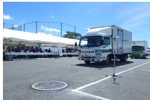
6-(17) 緊急物資搬送訓練