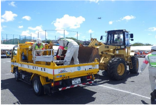
6-(13) 道路啓開・復旧訓練