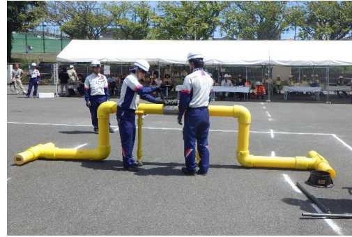
6-(22) ライフライン復旧訓練(ガス復旧)