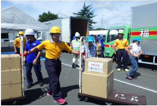
6-(17) 緊急物資搬送訓練