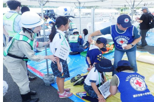
6-(9) 応急救護所開設・運営訓練