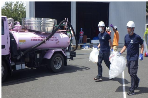
6-(23) 一般ごみ・し尿対応訓練