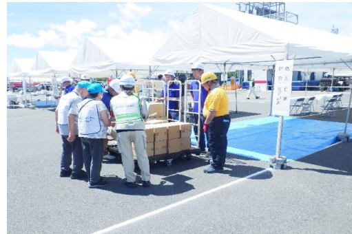
6-(16) 拠点倉庫開設・運営訓練