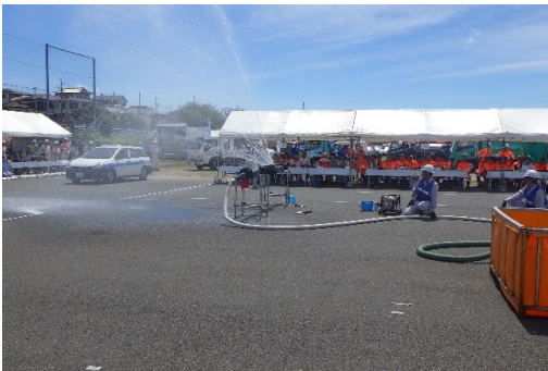
6-(22) ライフライン復旧訓練(水道管復旧)