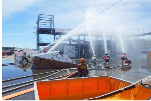
6-(20) 遠距離送・排水システム車を活用した 火災防ぎょ訓練