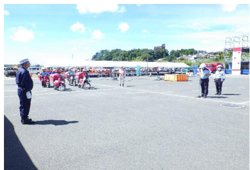
6-4) 情報収集伝達訓練(郵便局)