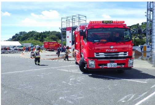
6-(20) 遠距離送・排水システム車を活用した 火災防ぎょ訓練