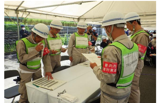
6-7 食料生活物資検討会議