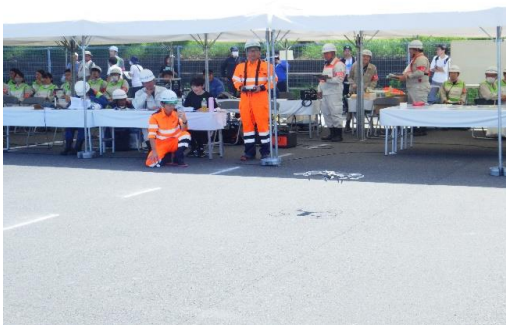
6-4) 情報収集伝達訓練(藤沢市建設業協会)