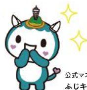
公式マスコットキャラクター ふじキュン♡

メディアの皆さん、こんにちは! 「キュンとするまち。藤沢」を私たち 市民編集部がお伝えします