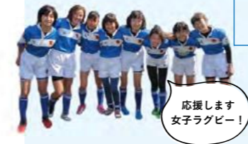
応援します 女子ラグビー!

現在は慶應義塾大学大学院とのコラボレーションで「藤沢プラス・テン」運動を展開し元気に活動しております。