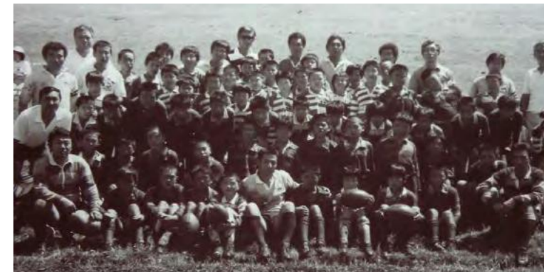
「藤ラグ」の歴史は長い。写真は1979年に行われた秋田市エコノム少年ラグビークラブとの交流試合の様子