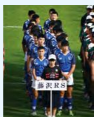
第10回全国中学生大会出場

シニアチーム 「湘南オールドボーイズ」 ラグビースクール指導員を中心とする40代以上のラグーマンで構成されており、幅広い年齢層でラグビーを楽しんでいます。