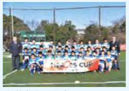
小学生全国大会ベスト8