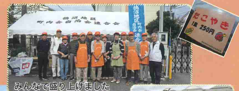
みんなで盛り上げました