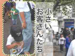
小さいお客さんたち