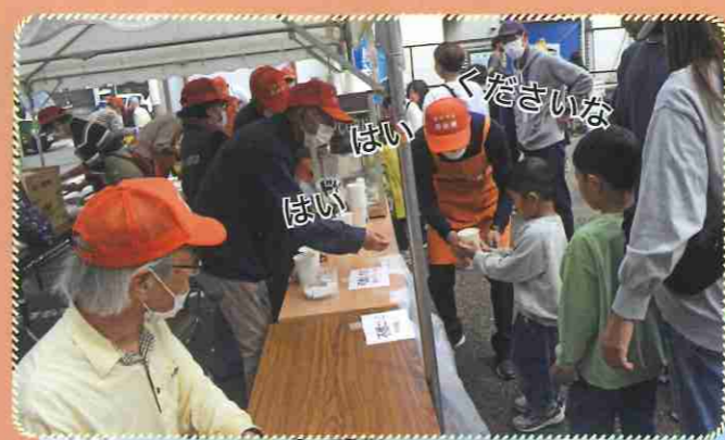
ポップコーンは50円 子どもたちに大人気