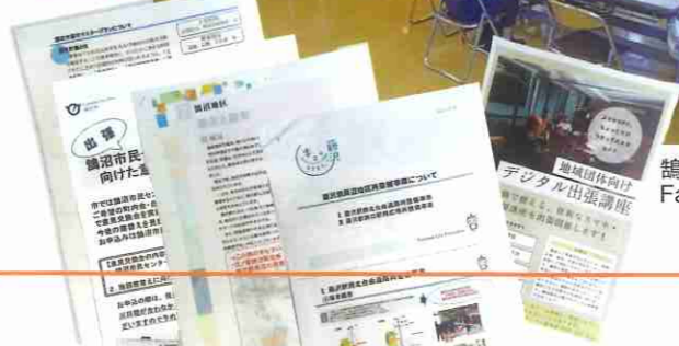
鶴沼自治連だより Facebook ページ