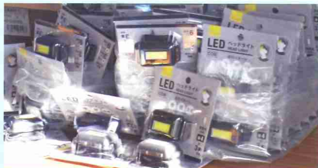
訓練当日配られたものはCanDoで揃えました

お薬手帳等のいつも持ち歩くものに笛・携帯トイレ・ヘッドライト・ビニール袋の4点セットをプラスすれば防災0時セットの出来上がり!