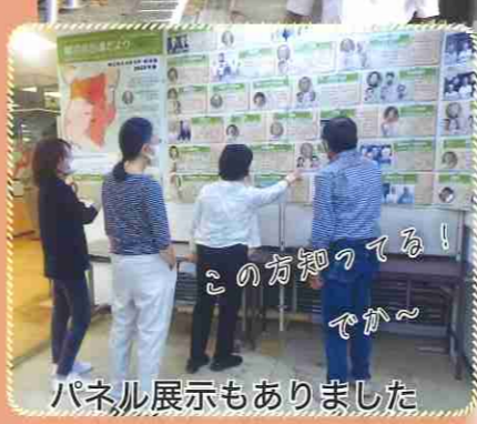
この方知ってる！ でか～