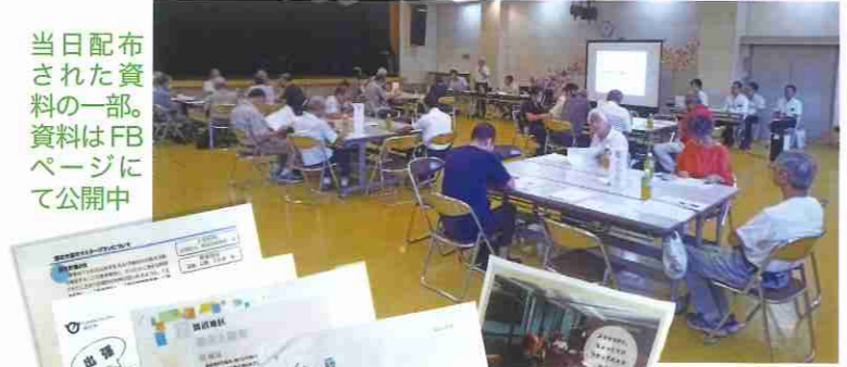
当日配布された資料の一部。資料はFBページにて公開中

ぞれの工夫も紹介されました。主な課題への取り組み(一部の紹介) ● 部長の任期を4年に限り縛られないように ● PTA役員就任者の自治会