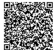
藤沢市電子申請システム

もう こ 申し込み： 6月10日（土）から6月23日（金）午後5時までに、 市ホームページの生涯学習総務課の公民館ページ、 もしくは右の2次元コードから電子申請で 申し込んでください。