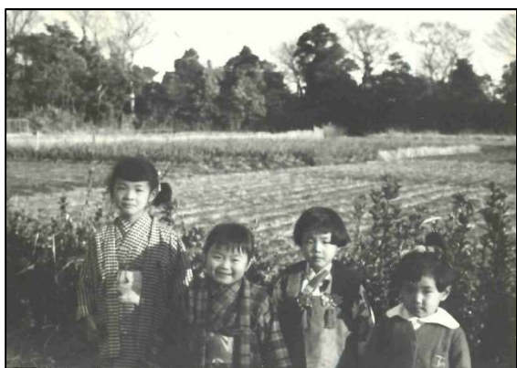
現在の北町公園付近の畑(昭和30年代)